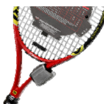
< テニス・ラケット >