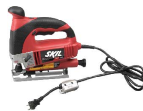
< 工具などの電源ケーブル >