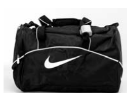
< バッグ >