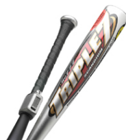
< バット >