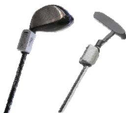
< ゴルフ・クラブ >